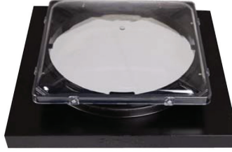
Hob (Curb) Mount