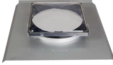
Custom Orb (CGI)

Sky Tunnel™ akrilik ve polikarbon kubbe seçeneklerini içerir. Akrilik, Altuglas HF17 malzemeden yapılmış olup hemen hemen tüm uygulamalarda kullanılabilir ve Sky Tunnel™ parçalar için standart malzeme olarak kullanılmaktadır. Bu akrilik; darbeye dayanıklı, UV dengeli, 1. derece işlenmemiş materyal olup görünür ışık geçişi %93'tür. Bu materyal Sky Tunnel™ ürünlerinde 20 yılı aşkın süredir kullanılmaktadır. Darbe dayanımının önemli olduğu uygulamalarda, Polikarbon Kubbe kullanılmalıdır. Bu malzeme üstün darbe dayanımı, UV dengeli olup görünür ışık geçişi %87 ve SABIC SLX malzemeden üretilmektedir.