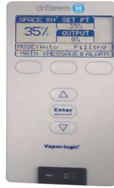
Vapor - logic 4 kumanda paneli